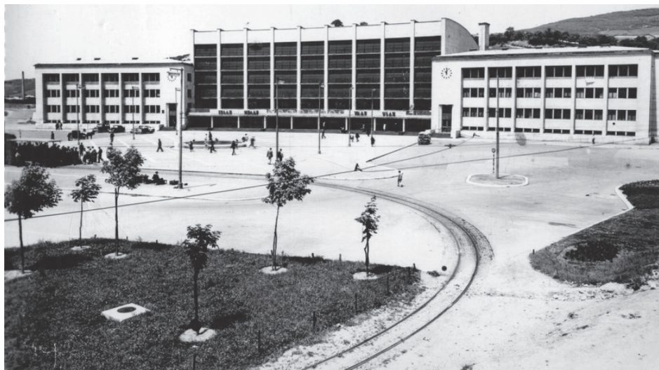
Slika 3: Nova željeznička stanica