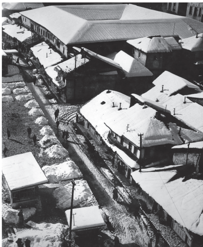
Slika 4: Pogled na ulicu Sarači, Morića han i lokalitet Kolobare hana prije rekonstrukcije dućana-trgovki (s kraja 60-tih i početka 70-tih godina XX stoljeća)

djelatnosti od Brusa-bezistana do ulice Sarači, od Bašçaršijske džamije do ulice Čizmedžiluk, dio dućana oko Bezistana, a od Kolobare-hana ostala su samo 4 vanjska zida (Čelić 1990b).