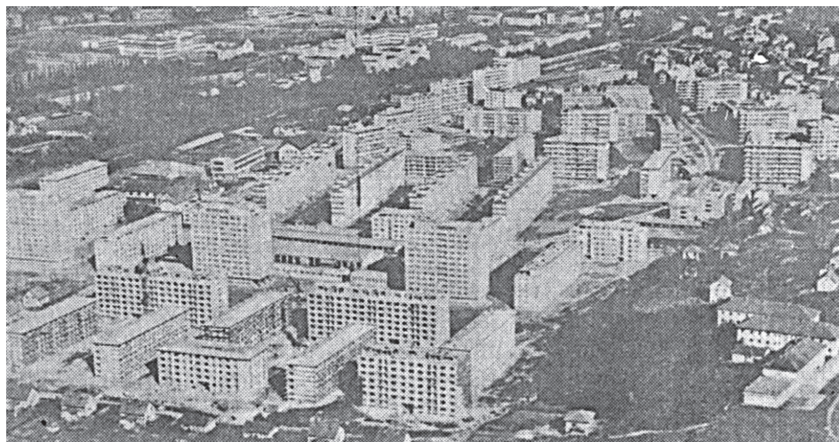
Slika 2: Grbavica u izgradnji

Međutim, Plan za Novi grad Sarajevo nije bio prihvaćen. Obzirom da su uslovi njegovog nastanka bili takvi da se nije mogla obezbijediti adekvatna geodetska podloga (korištene su karte iz austrougarskog perioda), niti detaljno proučavanje i analiza prostora, Plan je imao niz nedostataka. Međutim, Plan nije bio ni odbijen. Tražila se njegova dopuna, ali se istovremeno zauzeo stav da se prihvatljivi dijelovi Plana realiziraju. Tako se do 1950. godine izgradila današnja Željeznička stanica, bulevar Borisa Kidriča (današnja ulica Franca Lehara), ulica Đure Đakovića (današnja Alipašina ulica), most na Vrbanji (današnji Most Suade i Olge), objekti na Grbavici I, naselje „Čengić Vila“, „Višnjik“ i „Švrakino selo“, stadioni na Grbavici II i Koševu, veći broj pojedinačnih objekata. Alipašin Most i Stup se angažiraju za industriju, kao i drugi dijelovi grada (Buća-potok, Ilidža, Hrasnica, Vogošća).