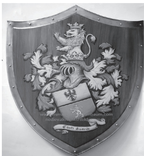
Štit sa grbom:

Ovaj frazem je nastao na osnovu izgleda štita i namjere vitezova. Naime, vitezovi su na svome štitu imali grb, na osnovu kojeg se moglo zaključiti odakle su, a iza štita su sakrivali svoje oružje, pa je tako nastala negativna konotacija ovog izraza.