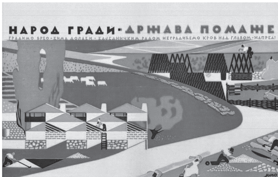
Slika 1: Plakat Ministarstva građevina BiH 1945-47. godina (Karlić – Kapetanović 1990: 130)