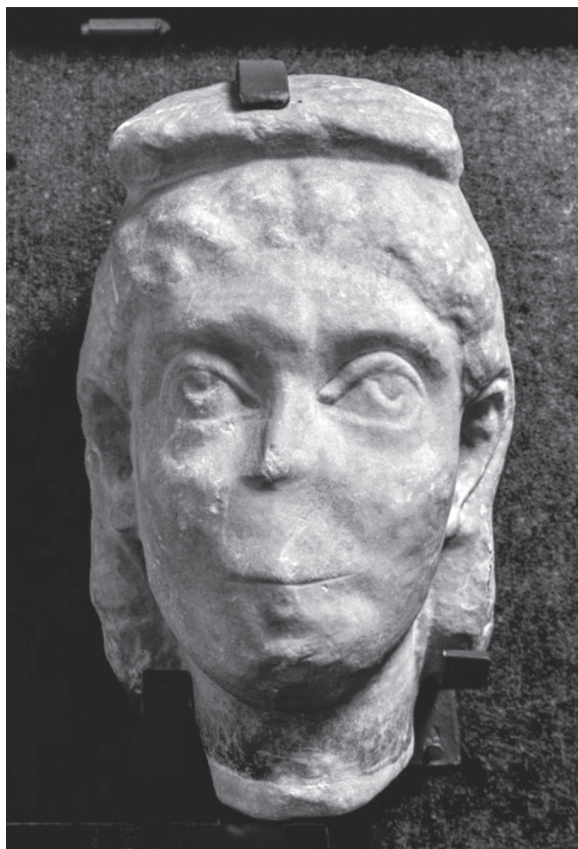
Mramorna glava iz Konjica

Na lokalitetu Crkvina, uz desnu obalu Trešanice, neposredno do njezina ušća u Neretvu, otkriveno je rimsko naselje i grobovi. Zapaženi su još tragovi rimske cigle i temelji zgrada. Na ovom mjestu je, također, pronađena glava ženske osobe, izrađena od mramora, koja datira u drugu polovinu III, ili u prvu deceniju IV stoljeća (Patsch 1902:311).