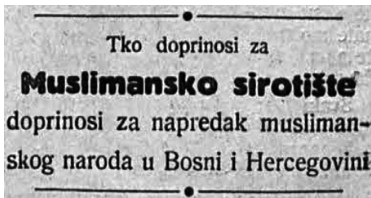
Sl. 3. Poziv na darivanje dobrovoljnih priloga sirotištu u dnevnoj štampi (Vakat, god. I, br. 124, 4. 6. 1914, str. 3)